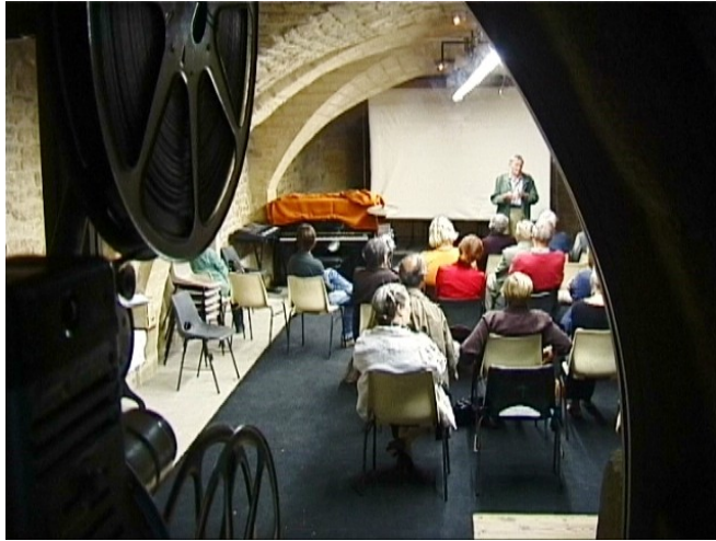
(cine concert projection 16mm association franco allemande)