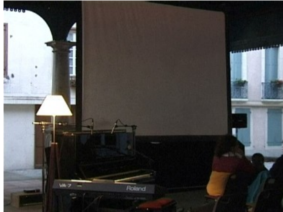
(Chalabre 7 art neuf)